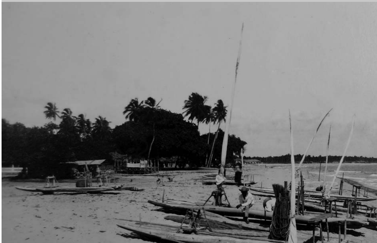
1940 - Praia de Tambaú - João Pessoa-PB