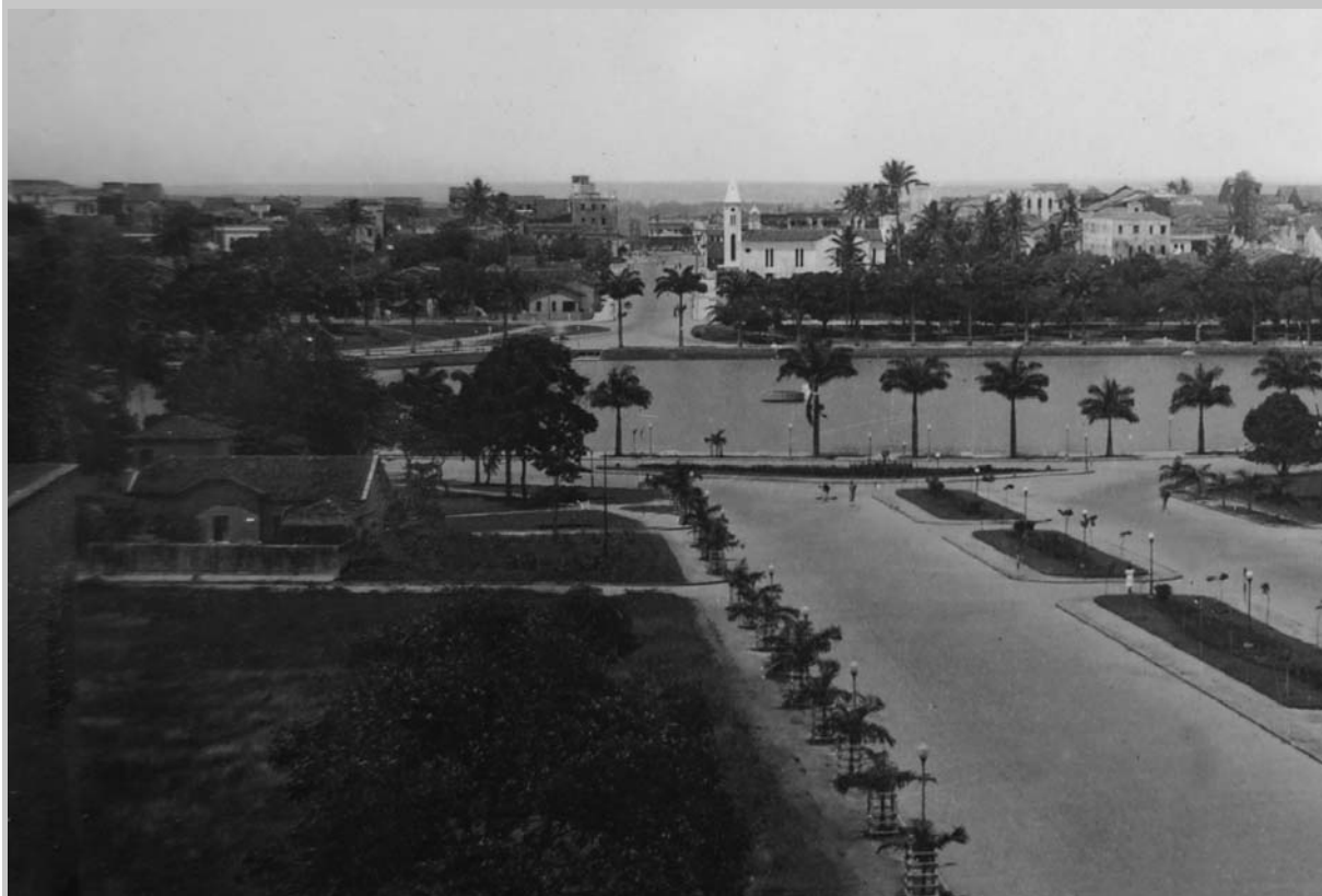
1940 - Av. Getúlio Vargas - João Pessoa-PB