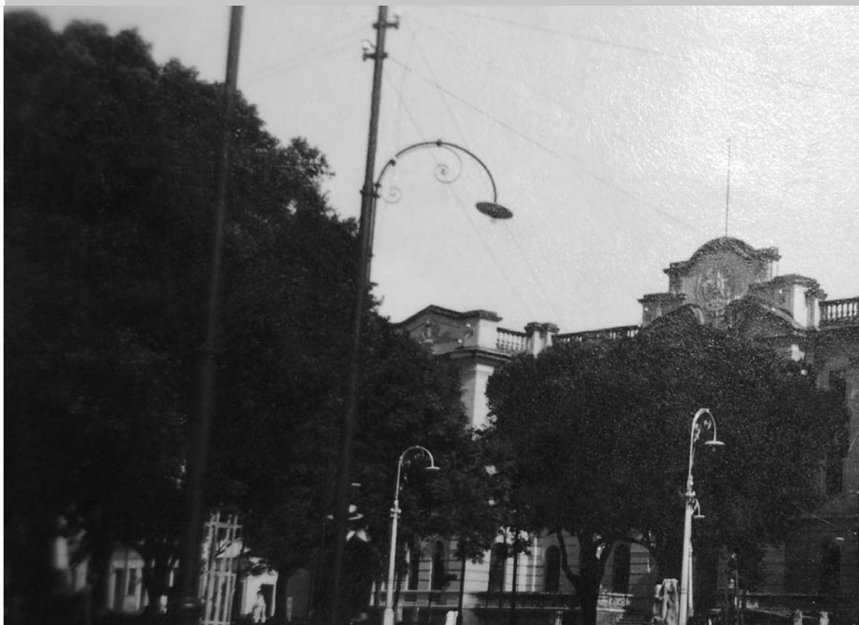
1940 - Correios e Telégrafos - João Pessoa-PB