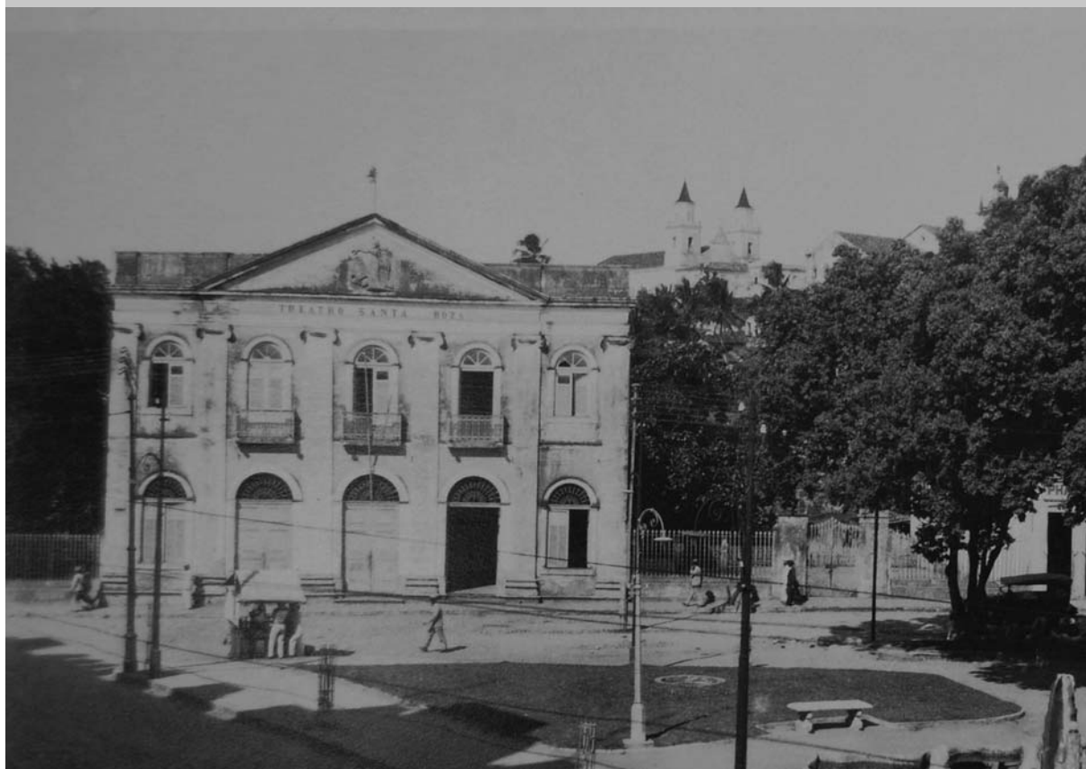
1920 - Praça Pedro Américo - João Pessoa-PB