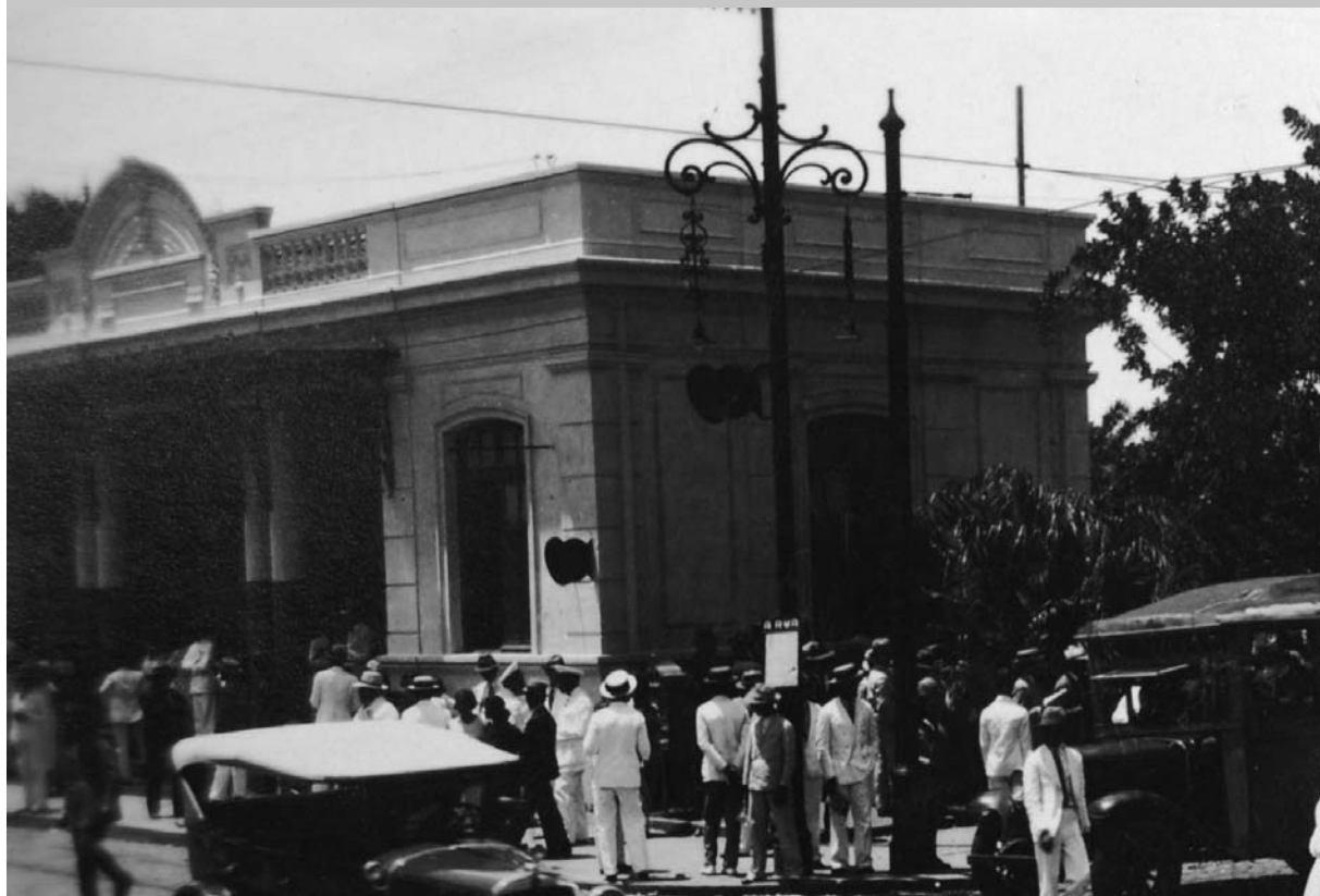
1930 - Ponto Cem Reis - João Pessoa-PB