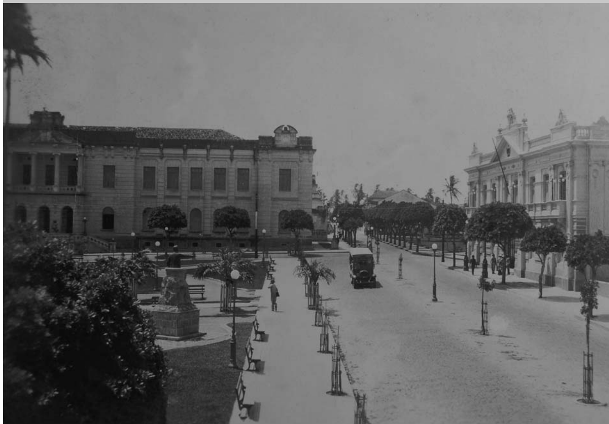
1930 - Praça João Pessoa - João Pessoa-PB